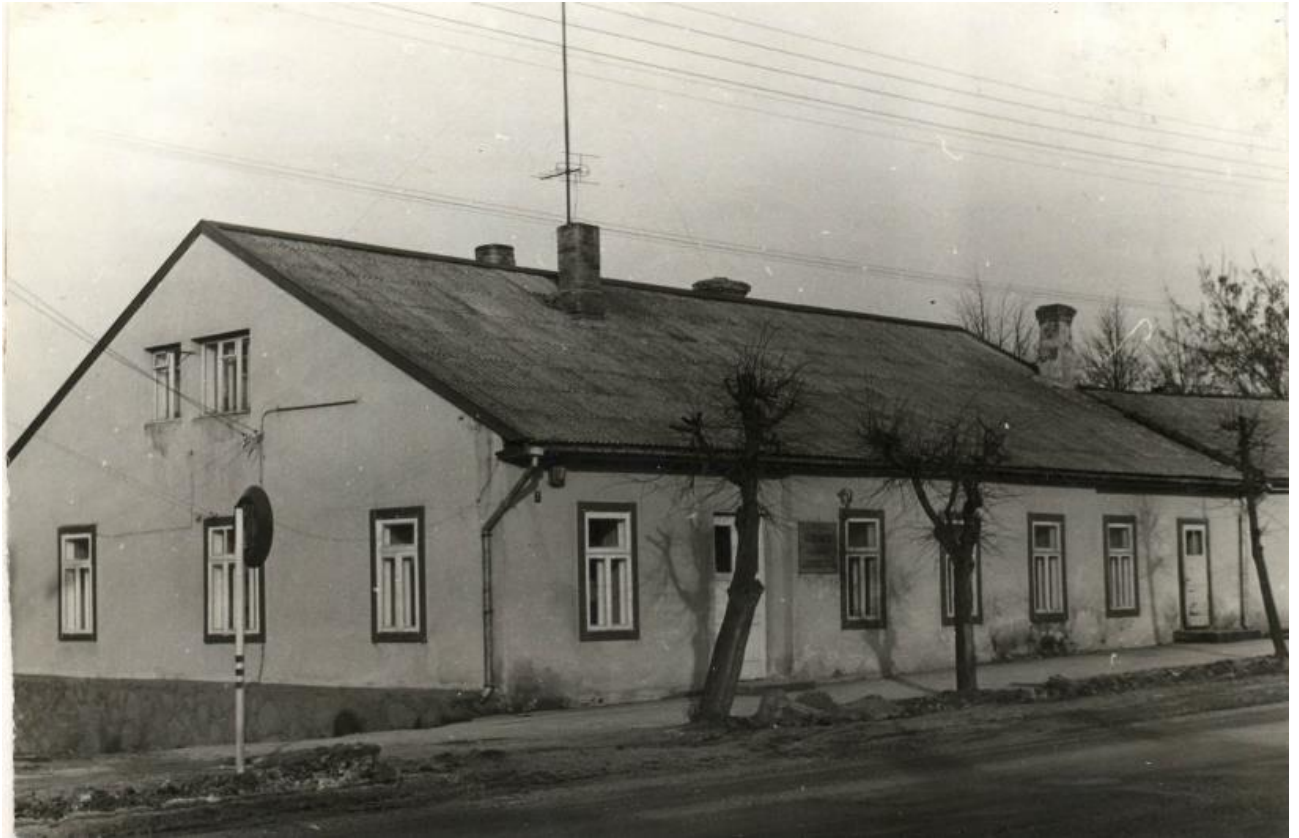
Carinės Zarasų miesto mokyklos pastatas ( fotografuota XX a. 8-9 deš.)