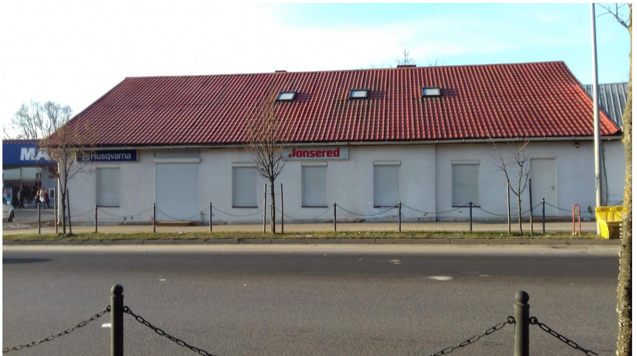
Zarasų gimnazijos pastatas iki 1931 m. (fotografuota 2017 m. gruodžio mėn.)