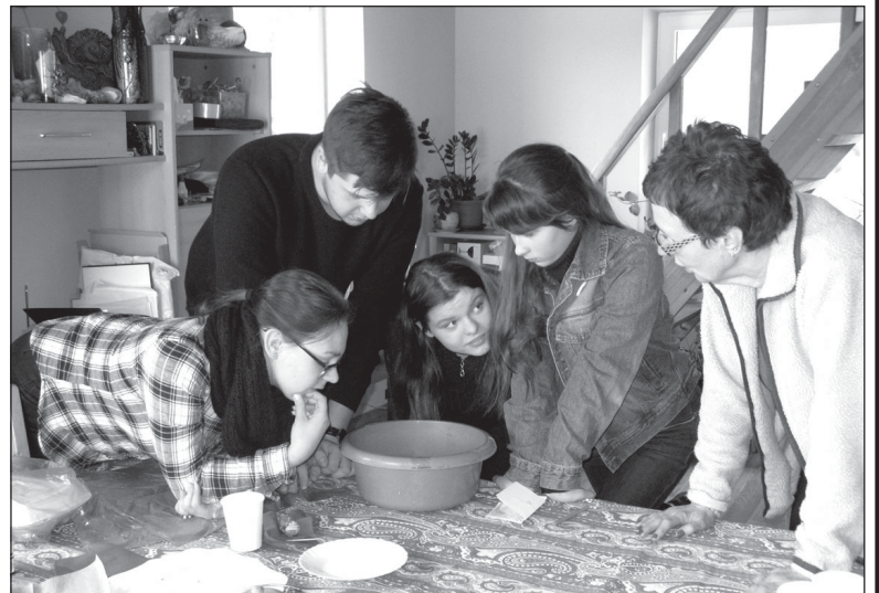
Sraigės maudymas – tikra relaksacija.