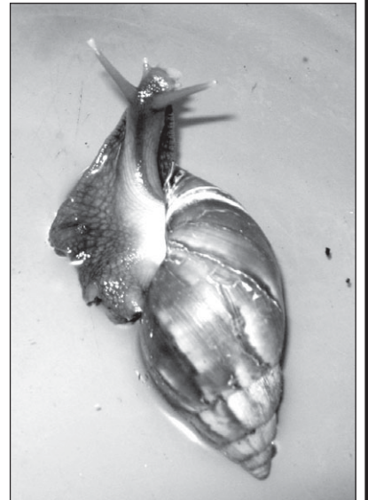
Gražuolė Achatina, kurią galima net paglostyti.